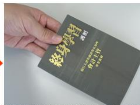
集滿檢核表發給護照 控管持續進修