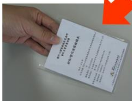
新上任發給檢核表 控管初任/替代進修